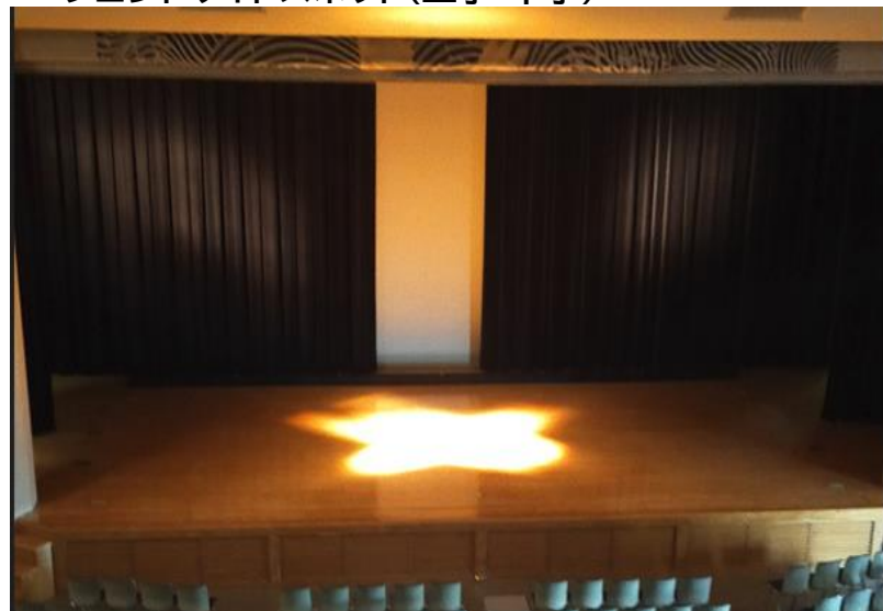
フロントサイドスポット(上手・下手)