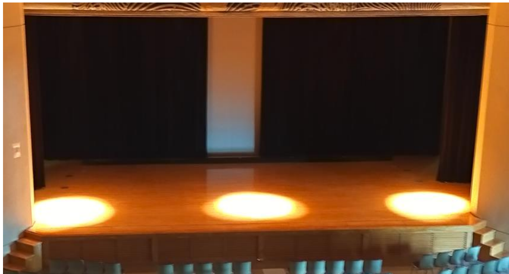
スポットライト(上手・中央・下手)