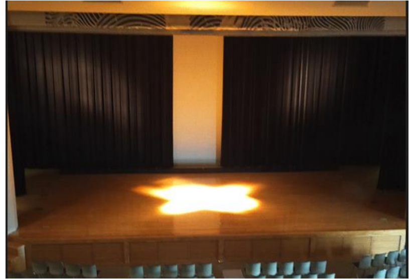
フロントサイドスポット(上手・下手)