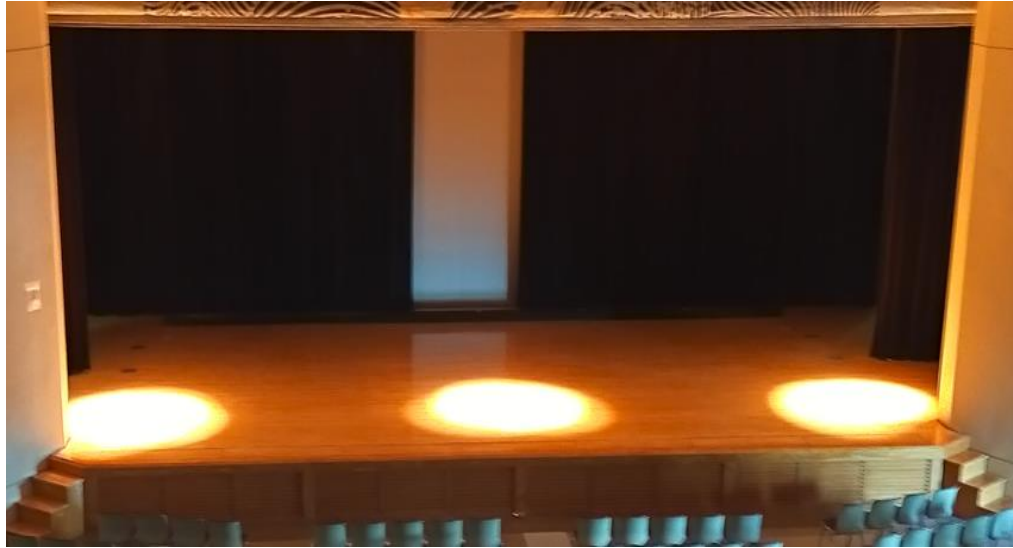
スポットライト(上手・中央・下手)